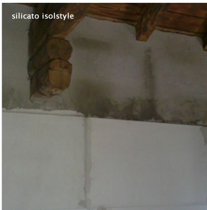
Applicazione in aderenza su parete in pietra intonacata

d) Ha un elevato pH, circa 10,5 che gli consente di combattere efficacemente ed in modo naturale le muffe non permettendo a queste di formarsi, inoltre è inattaccabile da insetti e roditori.