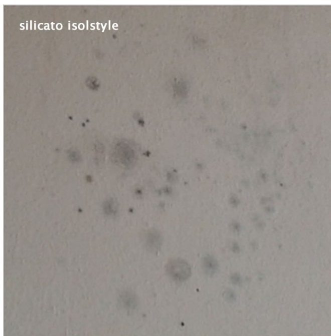
Formazioni di muffa

La muffa o meglio le muffe non rappresentano solo un danno di tipo estetico ad intonaci, tappezzerie ed arredi, ma sono indice di un ambiente malsano e pericoloso per la salute dell'uomo e degli animali che ci vivono, i batteri della muffa, infatti, possono causare irritazioni alle vie respiratorie, allergie ed asma.